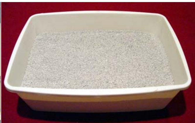
Bac à Litière Non-Couvert

Comme je l'ai fait remarquer plus haut, je préfère fortement les bacs à litière NON-couverts.