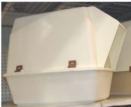
Bac à Litière Couvert