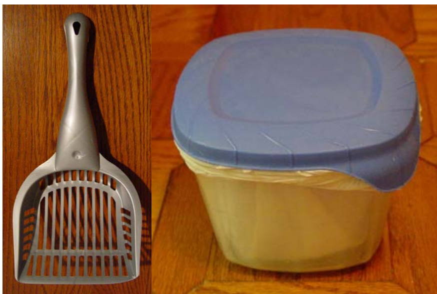
Pelle robuste et conteneur de déchets en plastique

Pour la méthode montrée dans la vidéo, il vous faudra une pelle faite de métal ou de plastique robuste. Certaines marques de pelles en plastique sont trop friables et cassent souvent. La marque Van Ness montrée ici est bien plus robuste.