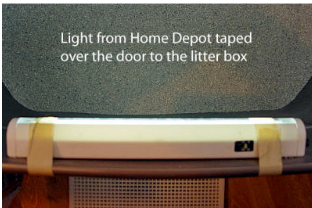
Eclairage de chez Home Depot scotché devant la porte du bac à litière

Voici une photo de l'éclairage que j'ai récemment ajouté au bac :